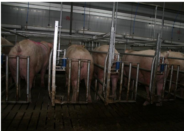
Abb. 3: Die Fressliegebuchten der Firma Tänzer verschließen sehr geräuscharm