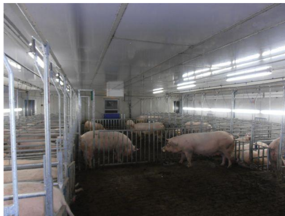
Abb. 4: Der 4 m breite Aktivitätsbereich bietet die erforderlichen Ausweichräume