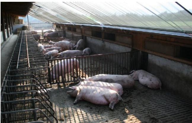
Abb. 7 : Auf Sonnenschutzmaßnahmen darf nicht verzichtet werden.