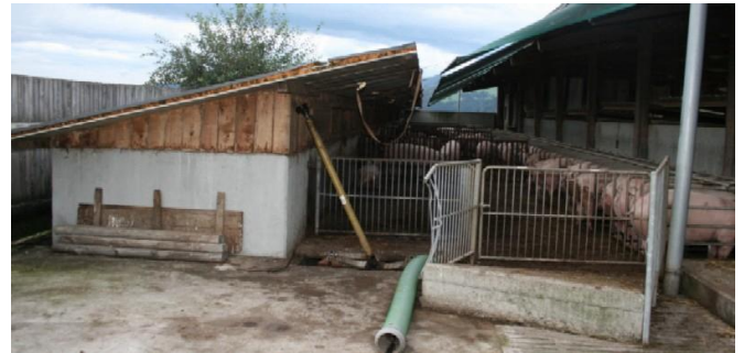
Abb. 2: Verladerampe und Rührschacht für das Slalomsystem.