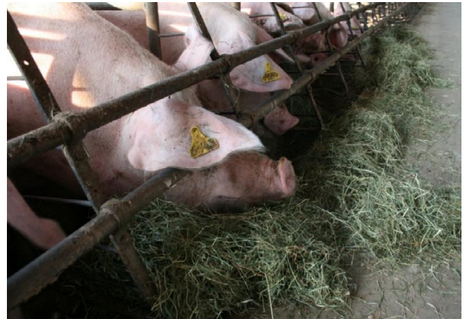
Abb. 6: Am späten Nachmittag gibt es eine extra Portion Heu an den Fressständen zur Beschäftigung.