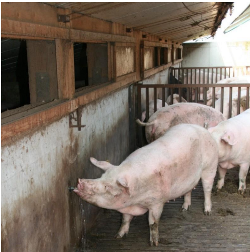
Abb. 3: Die Wasserleitungen sind im Hüttenbereich verlegt.