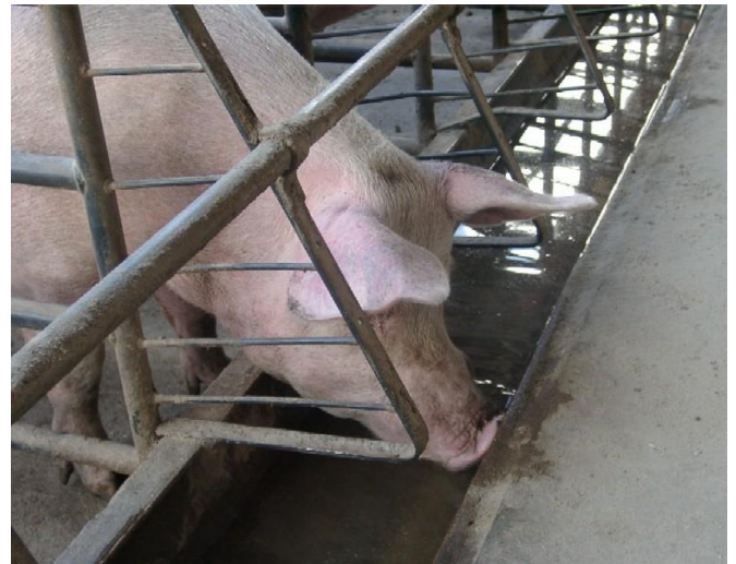
Abb. 4: Schweine bevorzugen als Saugtrinker Wasser aus Trögen.