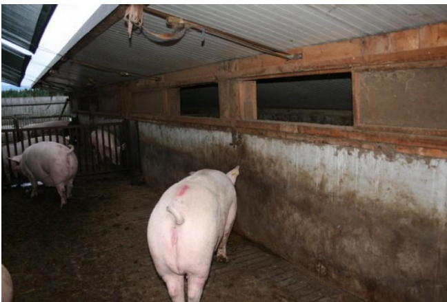
Abb. 10: Im Sommer sind die Holzschieber zur Belüftung ganz geöffnet.