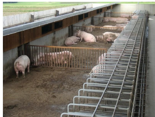
Abb. 8: Situation im Herbst bei abgenommenem Sonnenschutz.