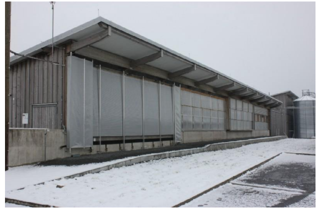
Stall in alternative Bauweise (Außenklimastall)