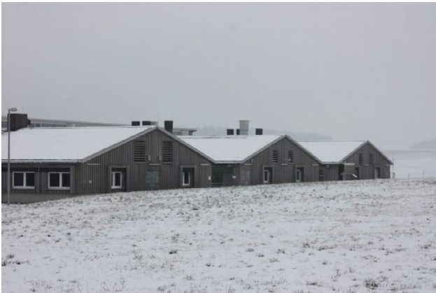
Stall in konventioneller Bauweise