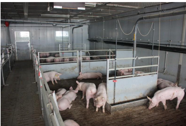
Mastschweine im klimatisiertem Abteil mit Flüssigfütterung