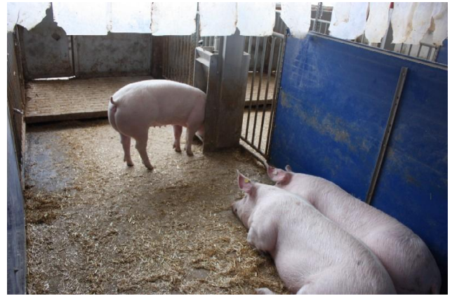
Mastschweine im Liegebereich der Stallungen der alternativen Bauweise

Für einen objektiven Vergleich des biologischen und wirtschaftlichen Leistungspotentials zwischen den Verfahren werden deshalb in den konventionellen sowie alternativen Stallungen des Bildungs- und Wissenszentrums Boxberg kastrierte männliche sowie weibliche Tiere gemästet. Für die vergleichende Auswertung von Mast- und Schlachtleistungsdaten verfügen die Tiere über die gleiche Genetik (BW*PI x BW*Hybridsau) sowie die gleiche Futtergrundlage. Um die Effekte des Haltungsverfahrens sowie des Geschlechts auf die unterschiedlichen Leistungsparameter festzustellen, wurden die Daten des Wirtschaftsjahres 2010/2011 mit einem linearen Modell ausgewertet. In die statistische Auswertung gingen das Geschlecht und das Haltungsverfahren als feste Effekte ein. In Tabelle 1 werden die Haltungsparameter in den Stallungen differenziert nach Bauweise und Gruppengröße beschrieben.