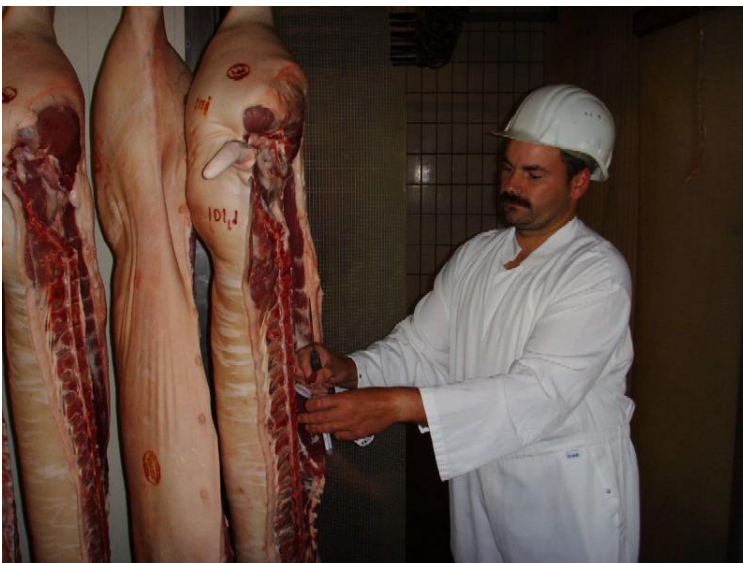
Abb. 1: Probeentnahme am Schlachthof e.G. Landkreis Böblingen in Gärtringen. Die meisten Mäster lassen Fleischsaftproben im Schlachthof ziehen.

*)sofern weniger als 26 Schweine zur Schlachtung abgegeben werden, sind alle Schweine zu untersuchen.