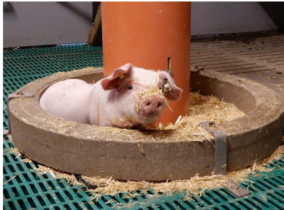
Abbildung 1: Beschäftigungsturm gefüllt mit gehäckseltem Stroh

Schweine haben ein sehr ausgeprägtes Erkundungsverhalten. Dabei untersuchen sie ihre Umgebung durch intensives Riechen und Bewühlen mit dem Rüssel. Kann das angeborene Erkundungsverhalten nicht oder nur in geringem Maße durchgeführt werden, führt das zu Frust bei den Tieren. Eine Folge davon können Verhaltensstörungen sein, wie Schwanzbeißen oder Anbeißen der Ohren von Artgenossen.