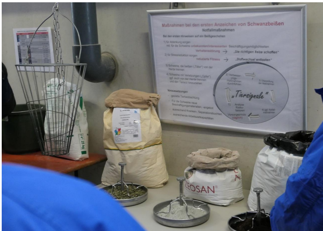
Abbildung 3: Beispiele für Materialien zur Sofortmaßnahme (Wühlerde, Zeolith und Luzernepellets)

Notfallmaßnahmen: Bei Hinweisen auf Schwanzverletzungen muss umgehend mit Notfallmaßnahmen reagiert werden. Wird Schwanzbeißen in einem frühen Stadium erkannt, ist das Herausnehmen des Täter-Tiers die beste Möglichkeit Manipulationen vorzubeugen. Kann der Täter nicht identifiziert werden, müssen die Tiere mit Beschäftigungsmaterial abgelenkt werden. Die Erfahrung zeigt gute Erfolge bei dem Einsatz von Papiersäcken, Wühlerde, Zeolith (Alumosilicate) oder anderen neuartigen, bekau- und bewühlbaren Materialien als Sofortmaßnahme. Es sollte daher immer eine Alternative zum dauerhaft angebotenen Beschäftigungsmaterial bereitstehen, die für eine sofortige Ablenkung und Beschäftigung der Tiere sorgt.