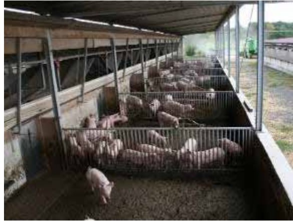
Betrieb 2: Auslauf planbefestigt mit Grüner Rinne