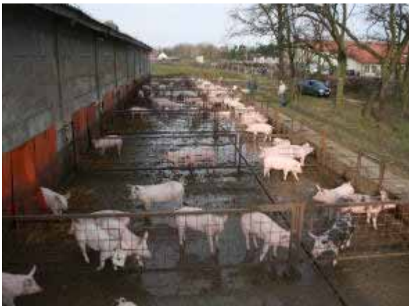
Betrieb 3: Auslauf planbefestigt, zu geringes Gefälle