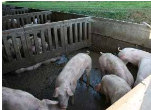
Betrieb 6: Auslauf planbefestigt, Faltschieber als Wechselschieber