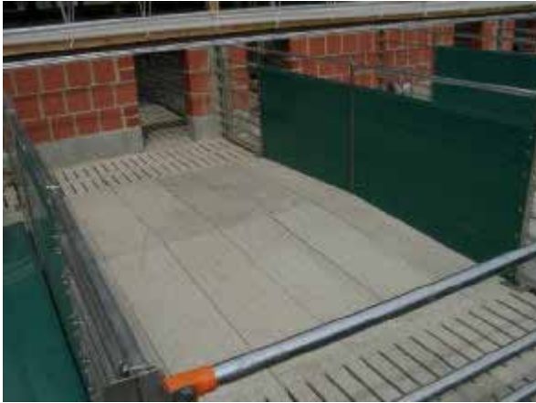
Betrieb 1: Auslauf mittig planbefestigt