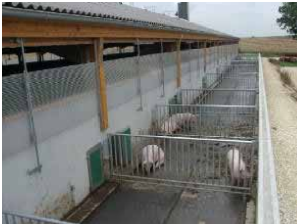
Betrieb 5: Auslauf planbefestigt, Klappschieber zur Entmistung