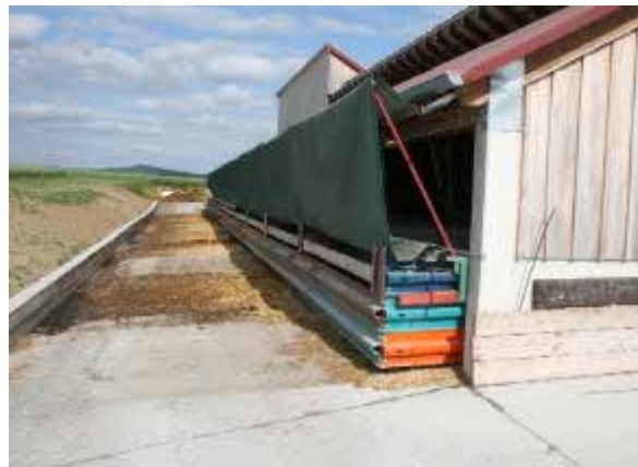
Betrieb 4: Auslauf planbefestigt, Teleskopbuchtentore sind eingezogen