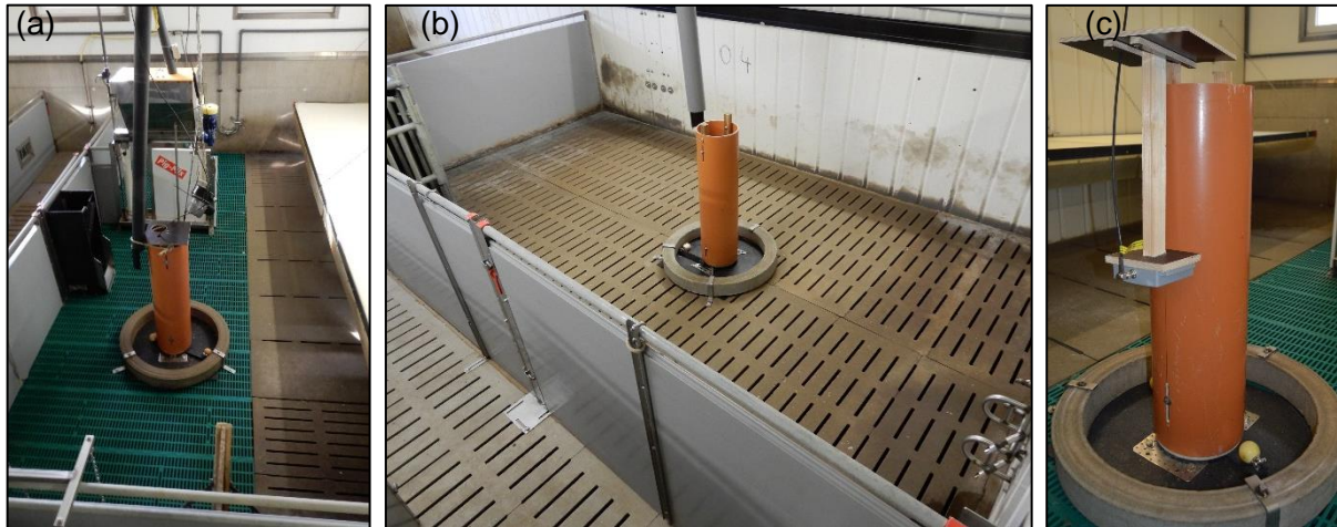
Abbildung 1: Beschäftigungsturm in (a) einer Aufzuchtbucht, (b) einer Mastbucht und (c) mit ausgebauter UHF RFID Antenne.