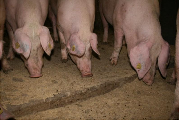
Abb. 5: Entscheidend bei der Bodenfütterung sind vorher zusammengewöhnte Sauengruppen