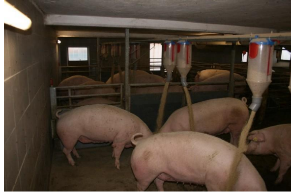
Abb. 6: Vier Volumendosierer für eine 10-er Sauengruppe sind gerade noch ausreichend