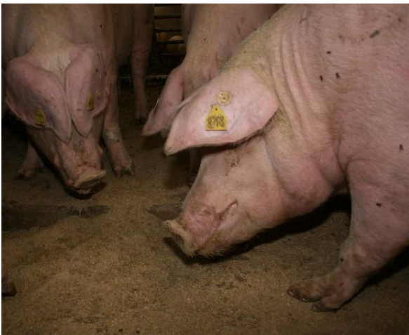
Abb. 3: Die Fresszeit dauert zweimal täglich je ca. eine Stunde