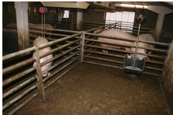
Abb. 4: Auf dem perforierten Bereich befindet sich die Wasserversorgung