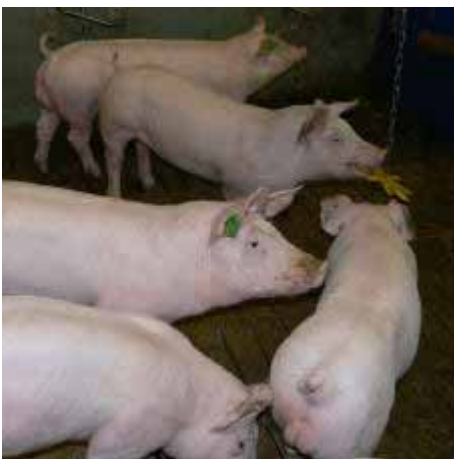
Abb. 1: Ebermast

In den 25 EU-Mitgliedstaaten werden jährlich etwa 100 Millionen männliche Ferkel (> 80 Prozent aller männlichen Ferkel) chirurgisch ohne Schmerzausschaltung kastriert. Ausnahmen sind von je her Großbritannien und Irland mit einer relativ geringen Sauenzahl (ca. 480.000 Tiere). Diese Länder werden jedoch überwiegend mit Schweinefleisch aus Ländern mit chirurgischer Kastration versorgt (z.B. Dänemark). In Portugal werden etwa 11 Prozent, in Spanien 33 Prozent sowie in Griechenland 75 Prozent der Ferkel kastriert. In den größeren Schweinezuchtbetrieben geht hier die Entwicklung eindeutig in Richtung Kastration aufgrund der Nachfrage aus dem Tourismus-Segment und dem Export von Schweinefleisch.