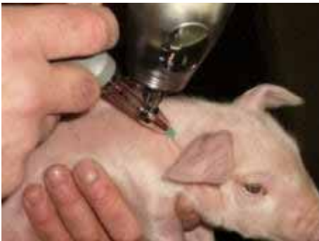
Abb. 2: Verabreichung schmerzlindernder Mittel

Alle derzeit praktizierten chirurgischen Verfahren mit Schmerzausschaltung sind mit mehr oder weniger großen Nachteilen verbunden. Sie sind entweder zu teuer, bewirken keine oder keine ausreichende Schmerzausschaltung, sind nicht praktikabel oder nicht sehr tierfreundlich. Es ist daher offensichtlich, dass es sich dabei eher um Zwischenlösungen handelt.