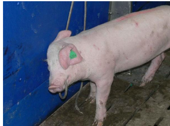
Abb.3: Hanf- oder Flachsseil