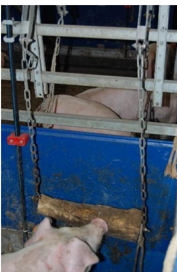
Abb. 4: Holzvippe zur gegenseitigen Animation

Stroh ist als Beschäftigungsmaterial wegen seiner vielfachen Funktionen zur Befriedigung des Erkundungsverhaltens gut geeignet. In strohlosen Systemen kann über so genannte Strohaufgabenstationen Häckselstroh angeboten werden. Als Verbrauchswerte werden in der Literatur Mengen von 10 - 80 g Stroh je Tier und Tag zur Beschäftigung angegeben. Gute Erfahrungen wurden bei der Haltung von Mastschweinen mit dem Einsatz von Holz an Ketten gemacht. Auch Hanfseile werden gut angenommen.