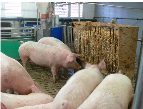
Abb. 1: Strohraufe in der Wechselgruppe

Für die Umsetzung der gesetzlichen Bestimmungen sollten Materialien zum Einsatz kommen, die eine vernünftige Kompromisslösung zwischen Tierschutz, Tiergesundheit und -hygiene sowie betriebswirtschaftlichen Aspekten darstellen. Hierfür gut geeignet sind Eisenketten mit daran befestigten Holzstücken. Die Ketten können miteinander verbunden werden - auch über Buchtenabtrennungen hinweg - um für die Tiere attraktiver zu sein. Eine Eisenkette allein erfüllt die Vorgabe eines „veränderbaren“ Materials nicht. Als Alternative können auch Hanfseile dienen, diese werden von den Tieren gern angenommen. Seile sowie Holzstücke können ohne viel Aufwand ersetzt oder erneuert werden, z.B. im Zuge der Stallreinigung.