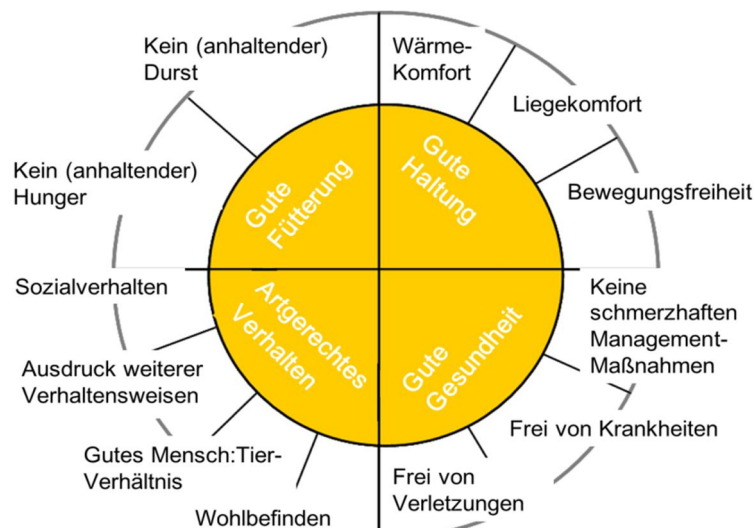
Abbildung 1: 4 Prinzipien und 12 Kriterien zur Bewertung des Tierwohls

Neu und besonders positiv hervorzuheben ist hierbei, dass das Tierwohl direkt am Tier z. B. über das Vorhandensein von sozialem Verhalten und nicht etwa nur indirekt über das Haltungssystem per se wie z. B. das Platzangebot erfasst wird (Welfare Quality®, 2009).